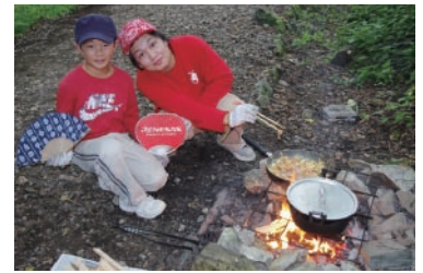
キャンプは子ども数人のグループ行動を基本とし、学生ボランティアがサポートします。