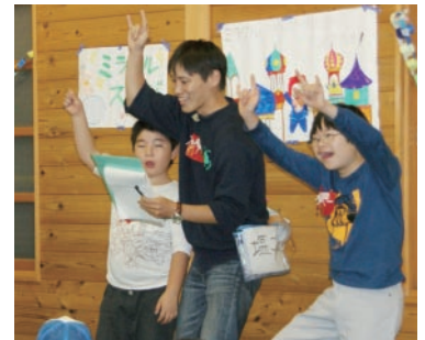
歌や寸劇などを披露するスタンツ大会は、子どもたちが積極的に発表し、互いを認め合う場になっています。