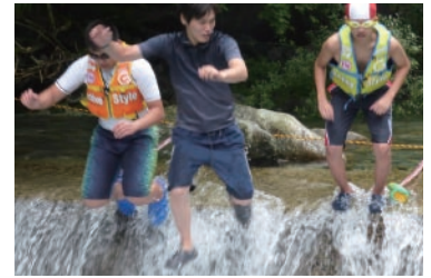
清流での飛び込みは、冷たくて気持ちがいい！ キャンプ生活には普段できない体験がいっぱい。